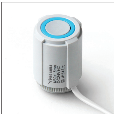
INS24NC.01 – напряжение питания 24 В DC, нормально закрытый.