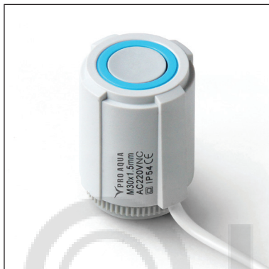
INS220NC.01 – напряжение питания 220 В AC, нормально закрытый.